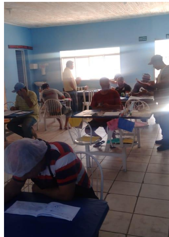
Atendimento Psicológico em Grupo