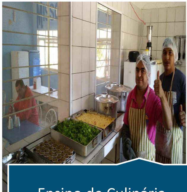
Ensino de Culinária