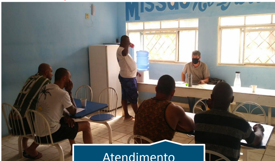
Atendimento Psicológico Individual