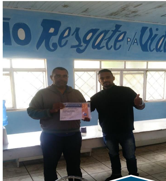
Entrega de Certificado de Conclusão do Tratamento