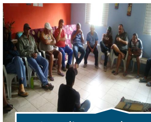
Atendimento de Monitoria em grupo