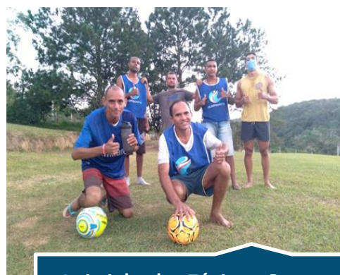
Atividade Física Com Educador Físico