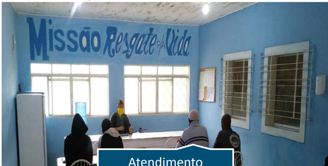
Atendimento Psicológico em Grupo