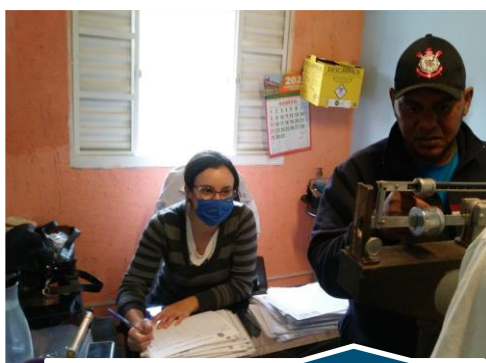
Atendimento de Enfermagem