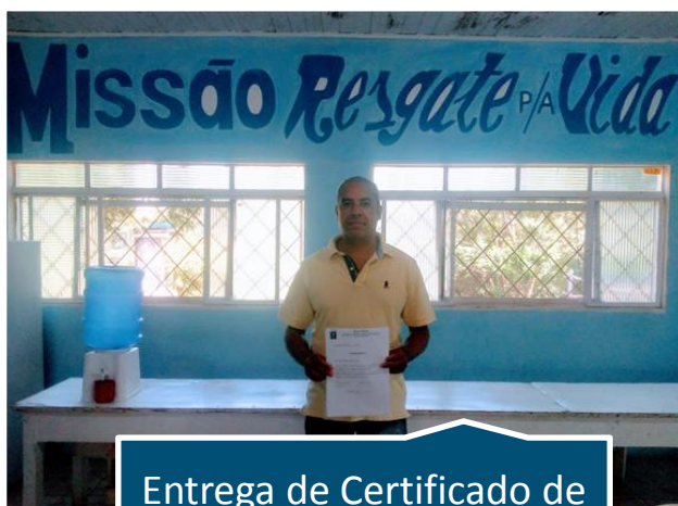
Entrega de Certificado de Conclusão do Tratamento