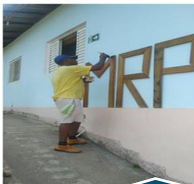
Ensino de Pintura Residencial